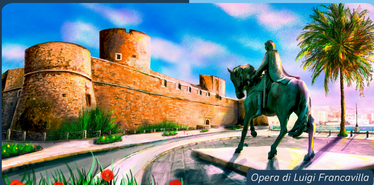
Opera di Luigi Francavilla